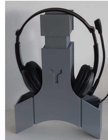
Réalisation en impression 3D